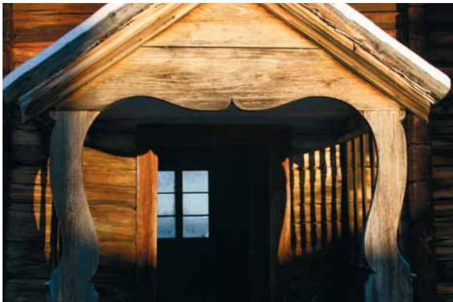
Karls i Järvsö – en världsarvsnominerad besöksgård